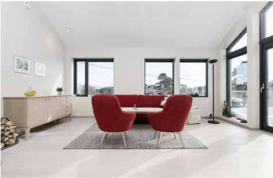
Den røde sofagruppera frisker opp i stua.