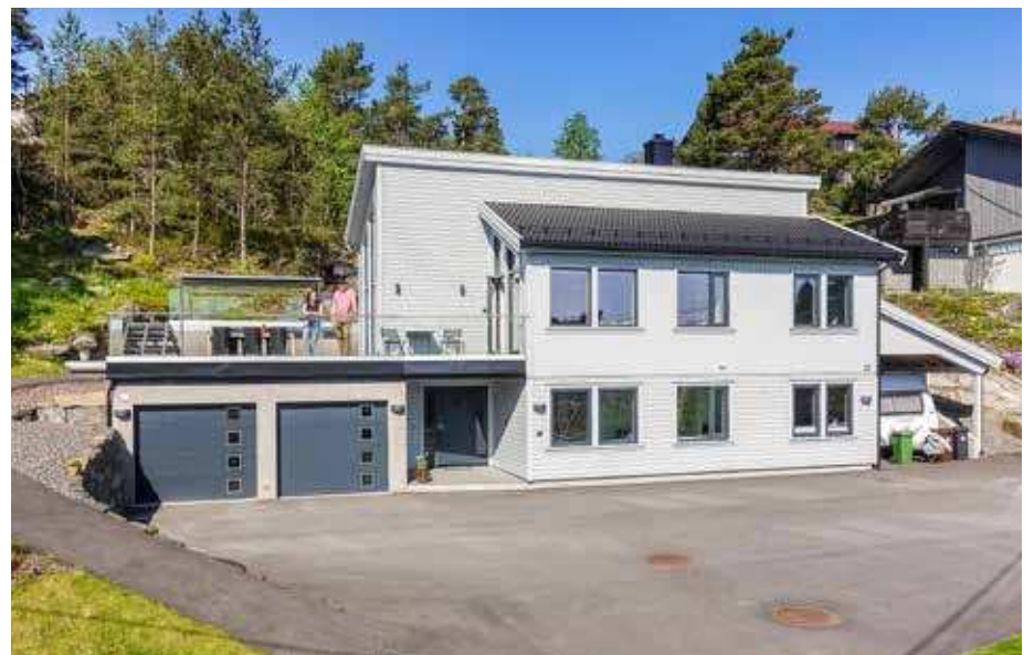
Huset er på rundt 180 kvadrat med dobbel garasje og egen carport til campingvogna.