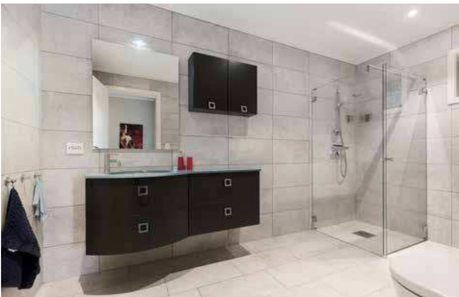
Badet er delikat innredet med fliser på golv og vegger.