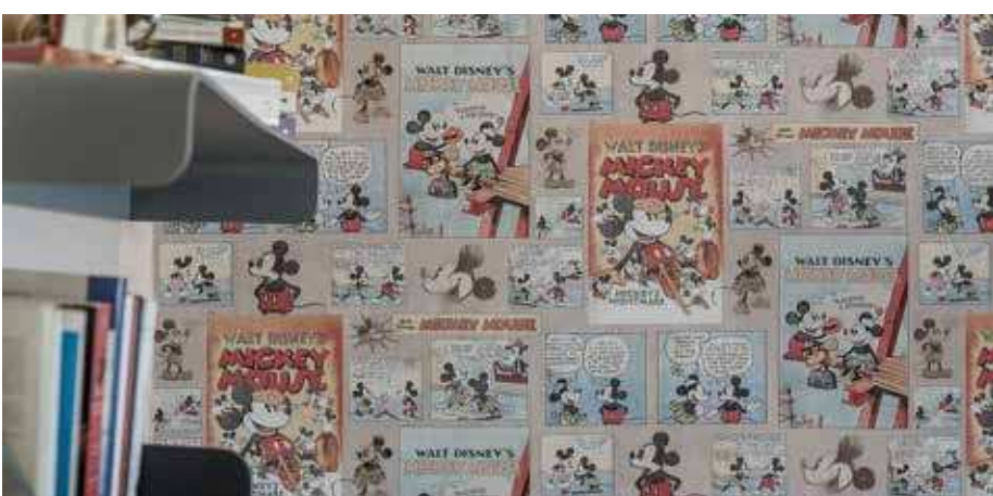
Tapetet på veggen er det Kai Olav som har valgt ut.