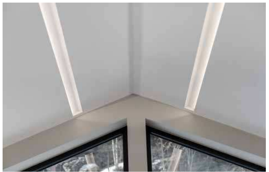
Kai Olav og Anita fikk hjelp av en lyseksperter for å få riktig belysning til huset.