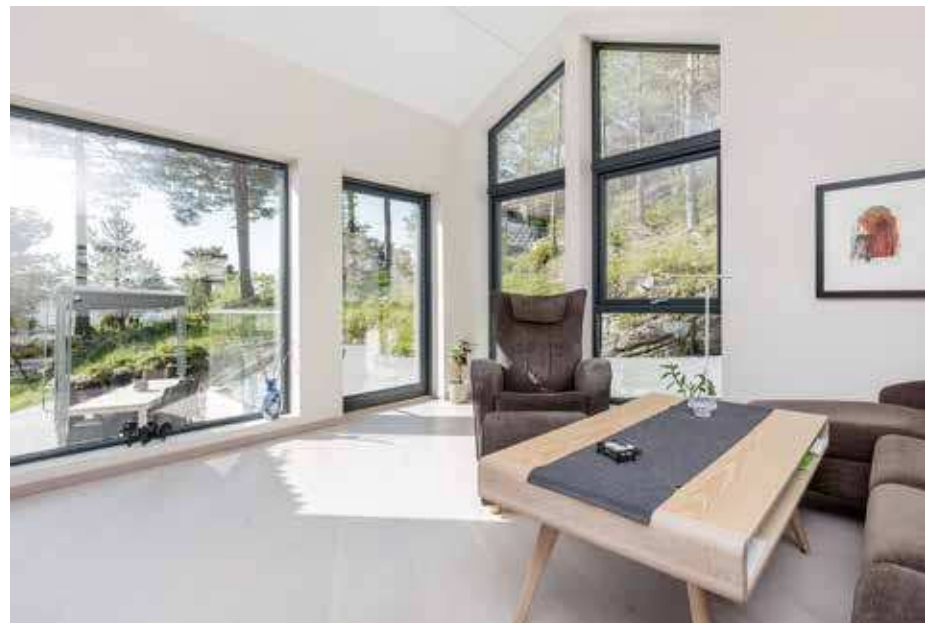
Anita og Kai Olav var opptatt av at de ønsket vinduer i alle rom.