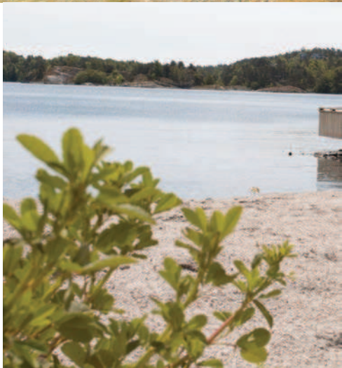
En lun sandstrand med eget grillområde og lekplasser på innsiden hører til området.