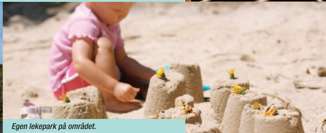
Egen lekepark på området.