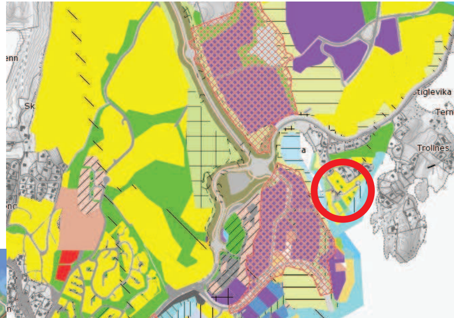
Reguleringsplan. Dyvig Brygge innringet.

Området innenfor Dyviga er planlagt utbygget med boliger, og snart kommer en helt ny tilførselsvei opp til E18. Dyvig Brygge er, foruten et godt sted å bo, en lur investering .