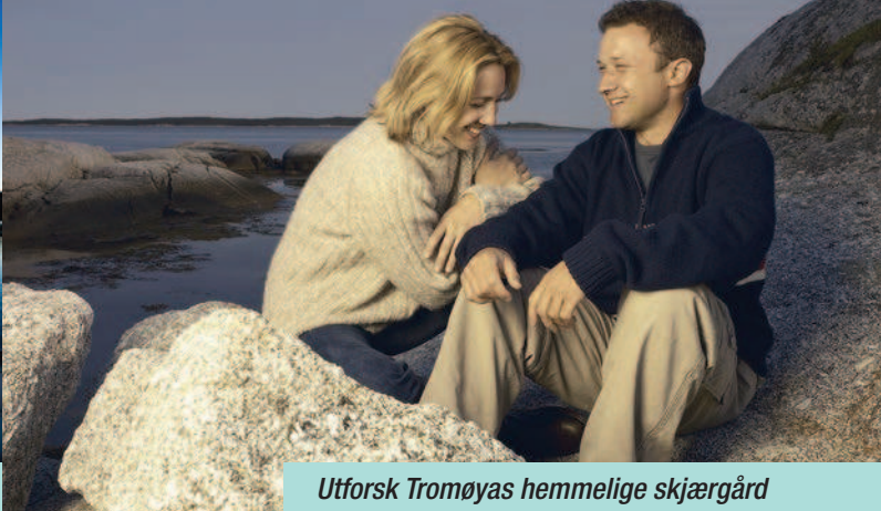
Utforsk Tromøyas hemmelige skjærgård