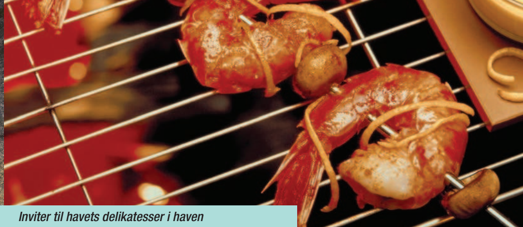
Inviter til havets delikatesser i haven