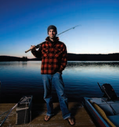
Kanskje en sjørret i kveldinga.