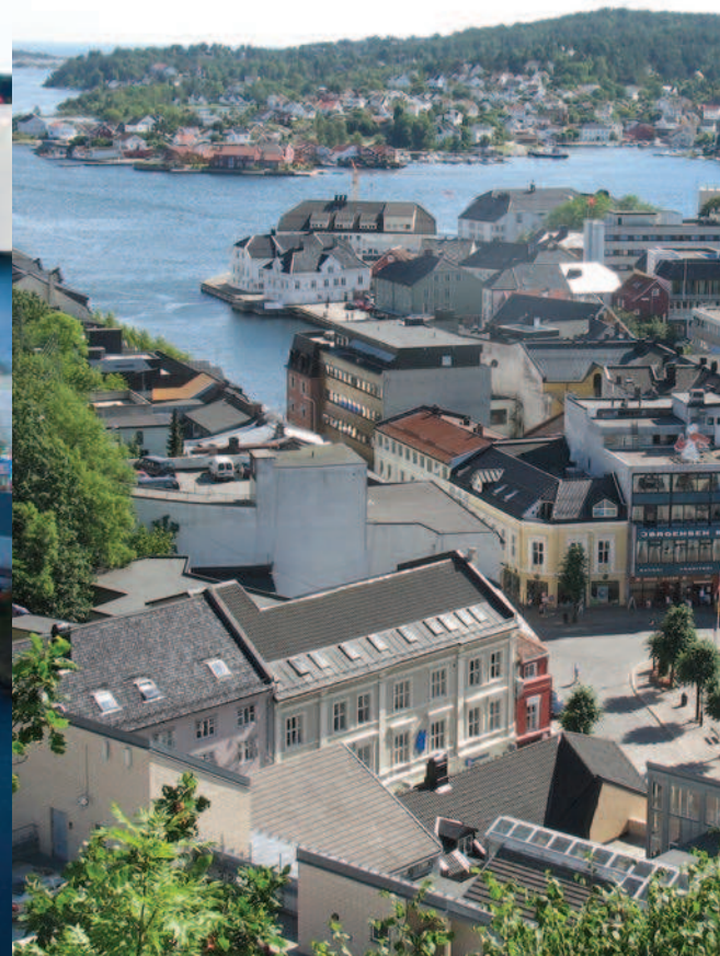
Bare 4 km fra Pollen i Arendal til Dyvig Brygge.